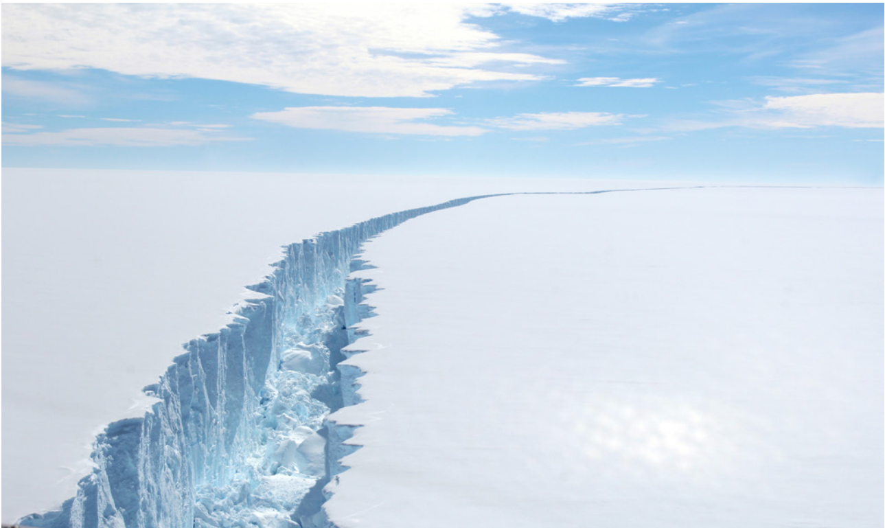
Gigantischer Riss im Larsen-C-Schelfeis in der Antarktis